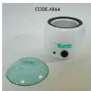
KÓD AR64 EFFIMERA OHŘÍVAČ VOSKU PROF800