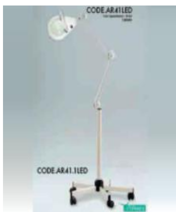
KÓD AR41 EFFIMERA LED LAMPA NA STOJANU – POJIZDNÁ 5.940 Kč, STOLNÍ

Přístroj se používá pro hloubkové čištění obličeje, využívání účinků páry, kterou je možno aromatizovat či obohatit čerstvým vzduchem.