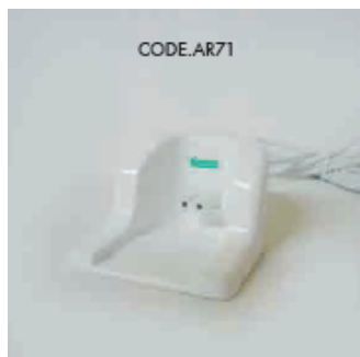
KÓD AR71 EFFIMERA STOJAN PRO OHŘÍVAČ DEPILAČNÍHO VOSKU -