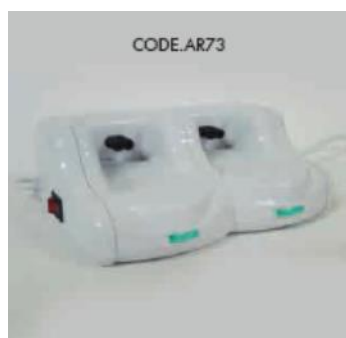
KÓD AR73 EFFIMERA DVOJSTOJAN PRO OHŘÍVAČ DEPILAČNÍHO VOSKU