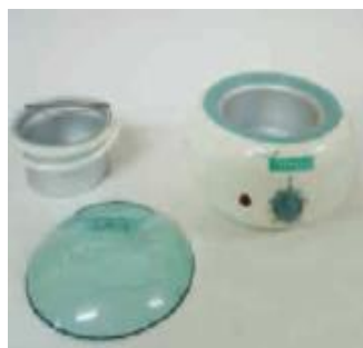
KÓD AR65 EFFIMERA OHŘÍVAČ VOSKU PROF 400 č