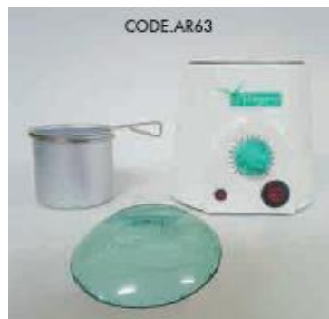
KÓD AR63 EFFIMERA OHŘÍVAČ VOSKU PROF 250