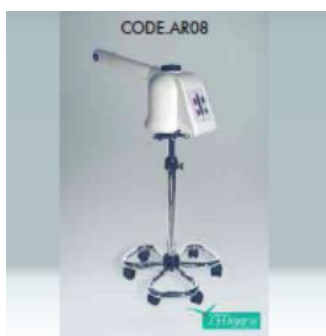
KÓD AR08 EFFIMERA VAPORIZÉR S PRODLOUŽENÝM RAMENEM - POJIZDNÝ

Přístroj se používá pro hloubkové čištění obličeje, využívání účinků páry, kterou je možno aromatizovat či obohatit čerstvým vzduchem.