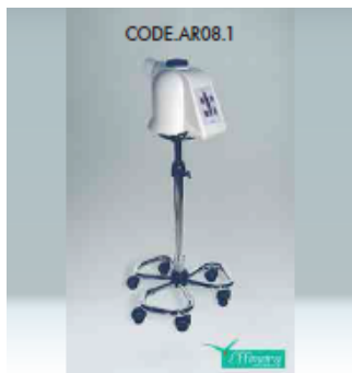
KÓD AR08.1 EFFIMERA VAPORIZÉR - POJIZDNÝ

Přístroj se používá pro hloubkové čištění obličeje, využívání účinků páry, kterou je možno aromatizovat či obohatit čerstvým vzduchem.