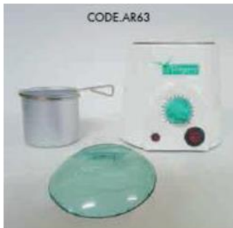
КОД AR63 EFFIMERA НАГРЕВАТЕЛ ЗА ВОСЪК СЪД ПРОФ. 250 КОНТРОЛ НА ТЕМПЕРАТУРАТА

Effimera ScaldaCera Prof 250 Аксесоари: захранващ кабел, нагревател за гилзите, технически данни: 240V, мощност 50W