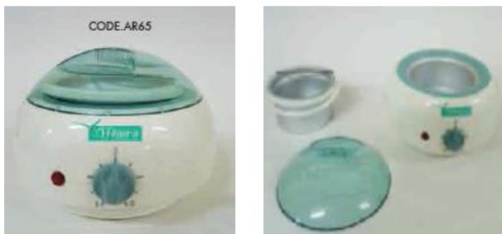
КОД AR65 EFFIMERA НАГРЕВАТЕЛ ЗА ВОСЪК СЪД ПРОФ. 400 КОНТРОЛ НА ТЕМПЕРАТУРАТА

Effimera ScaldaCera Prof 250 Аксесоари: захранващ кабел, нагревател за гилзите, технически данни: 240V, мощност 50W